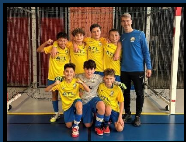
AS Saint-Martin en Haut