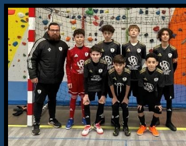
US Meyzieu (2)