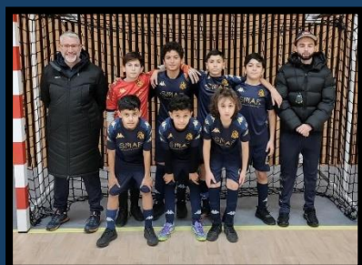
SC Bron Terraillon