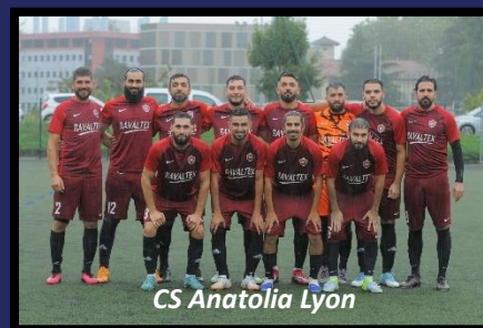
CS Anatolia Lyon