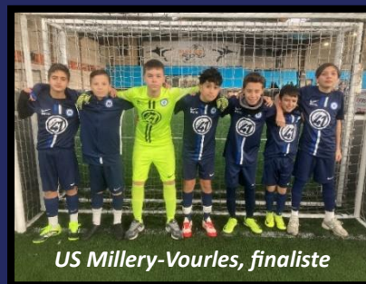
US Millery-Vourles, finaliste

PERMANENCE TELEPHONIQUE (horaires et terrains) : vendredi 13 février 2026 à partir de 18 h 00