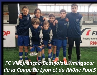
FC Villefranche-Beaujolais, vainqueur de la Coupe de Lyon et du Rhône Foot5