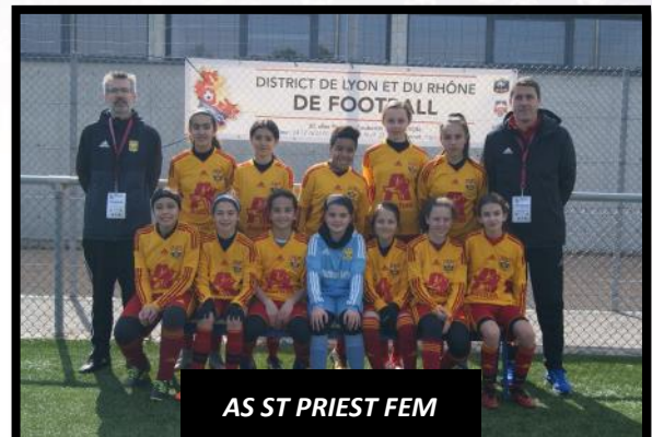
AS ST PRIEST FEM