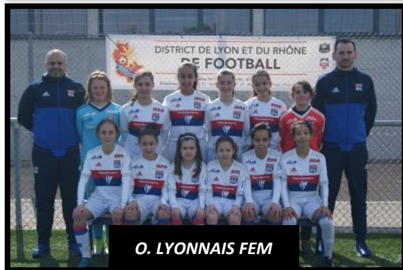
O. LYONNAIS FEM