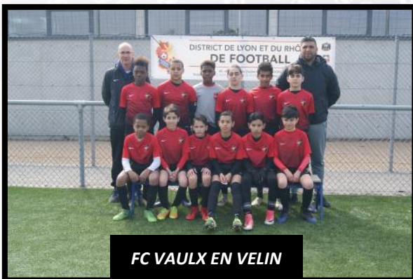
FC VAULX EN VELIN