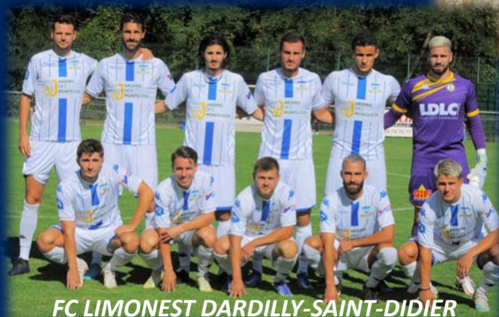
FC LIMONEST DARDILLY-SAINT-DIDIER