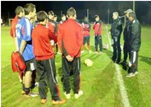
Matinée Recyclage Samedi 1er Décembre 2018 (U12 et U13)