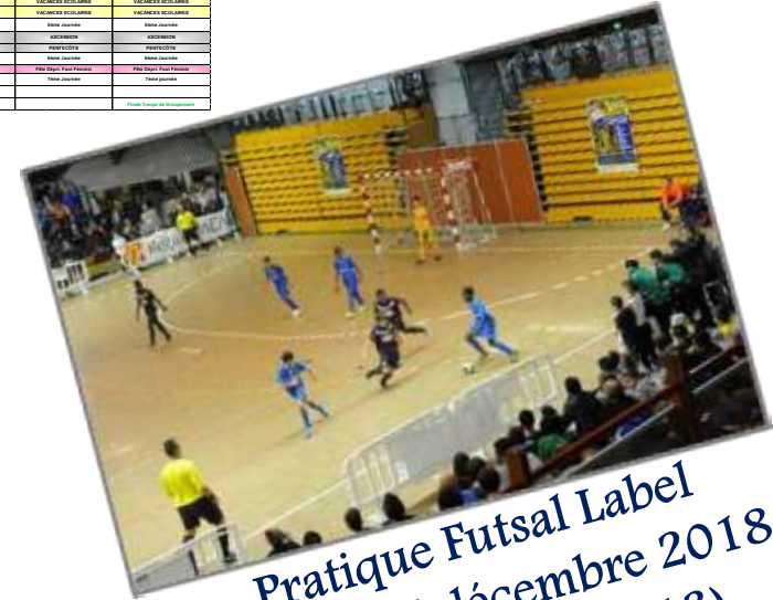
Pratique Futsal Label Samedi 15 décembre 2018 (uniquement les U13)